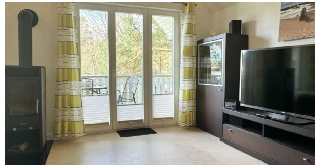
Zugang zum Balkon