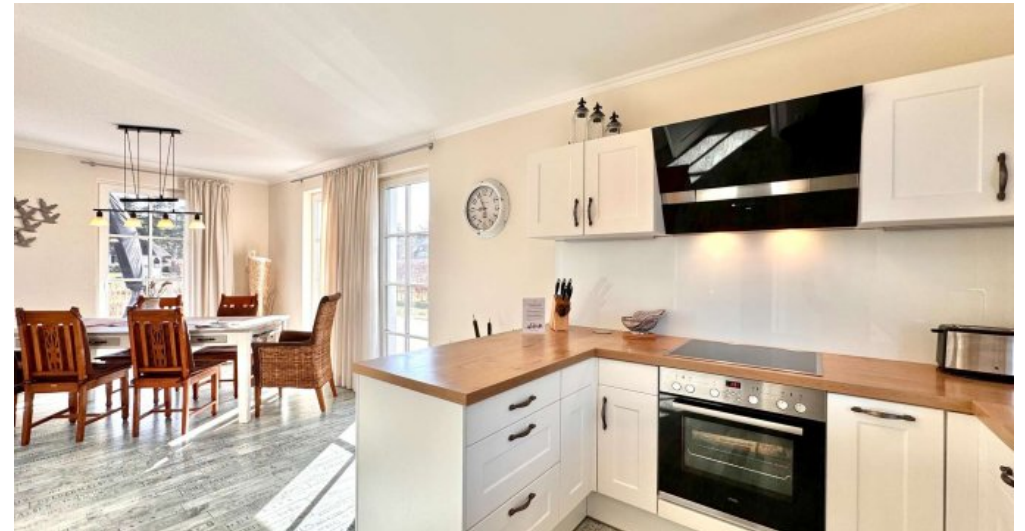
Küche und Essbereich