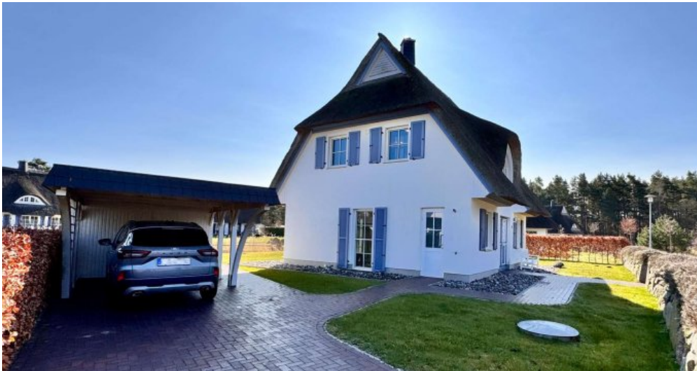
Ansicht Giebel und Carport