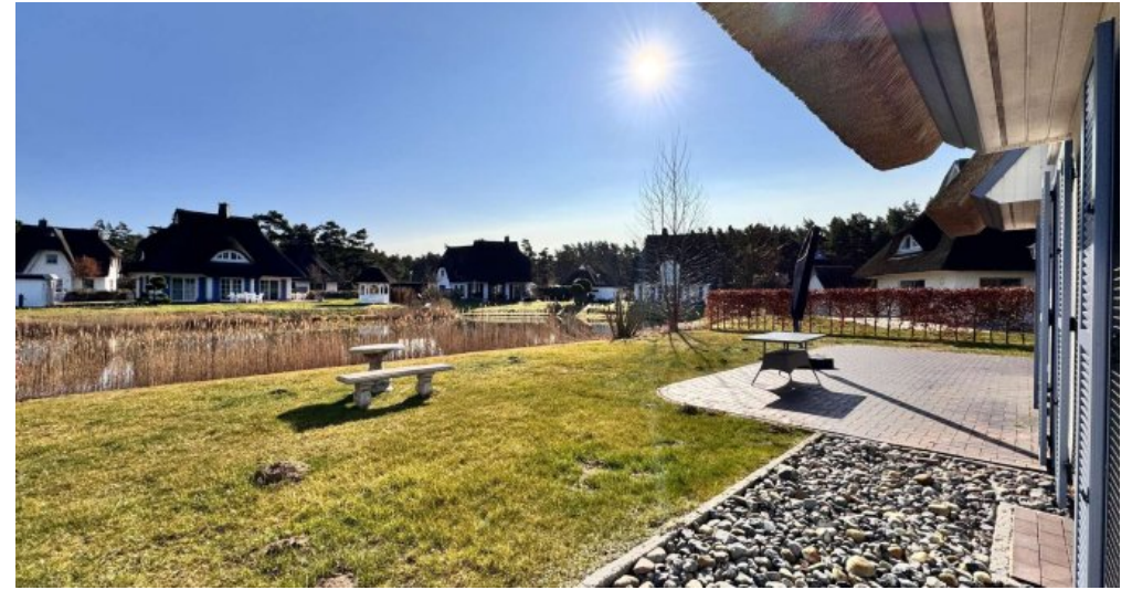
Garten und Teich