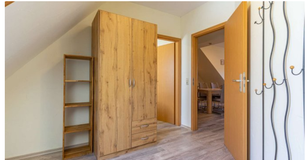
Fewo 5 - Schlafzimmer