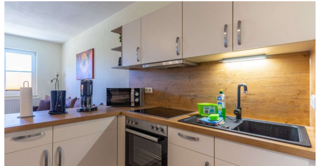
Fewo 5 - Küche