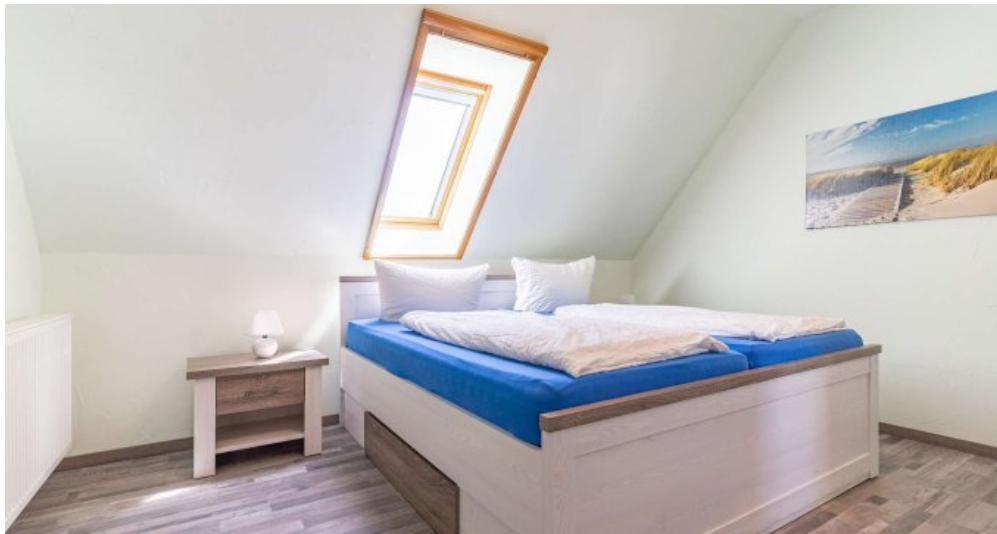
Fewo 4 - Schlafzimmer