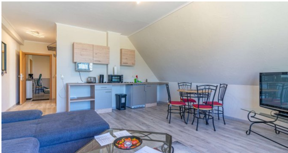
Fews 3 - Wohnzimmer