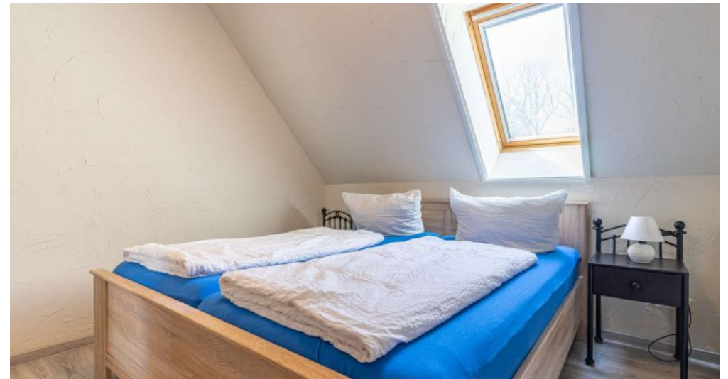
Fewo 3 - Schlafzimmer