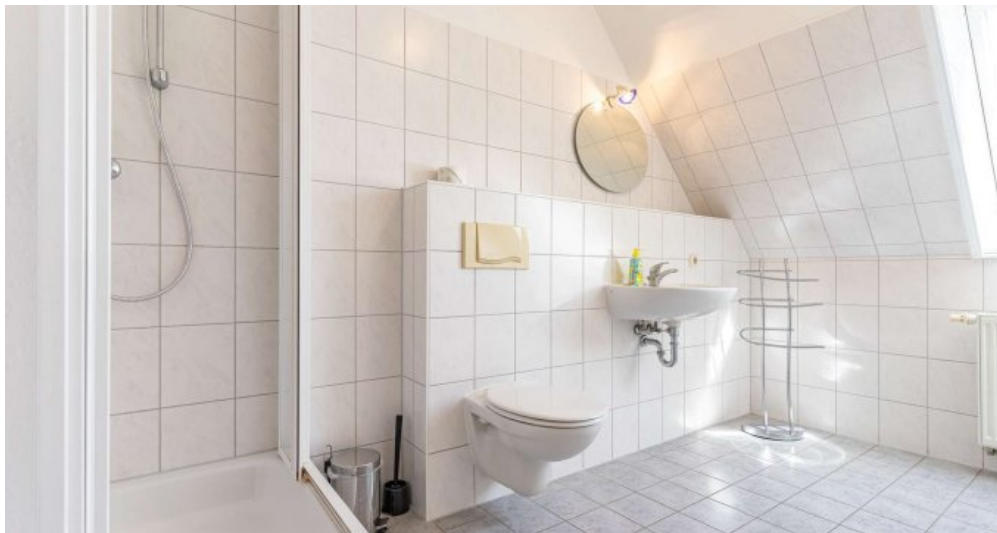
Fewo 4 - Bad