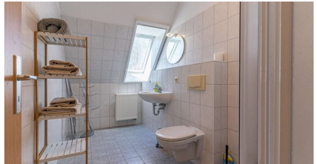
Fews 3 - Bad