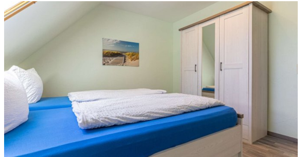
Fewo 4 - Schlafzimmer