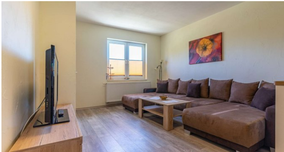
Fewo 5 - Wohnzimmer