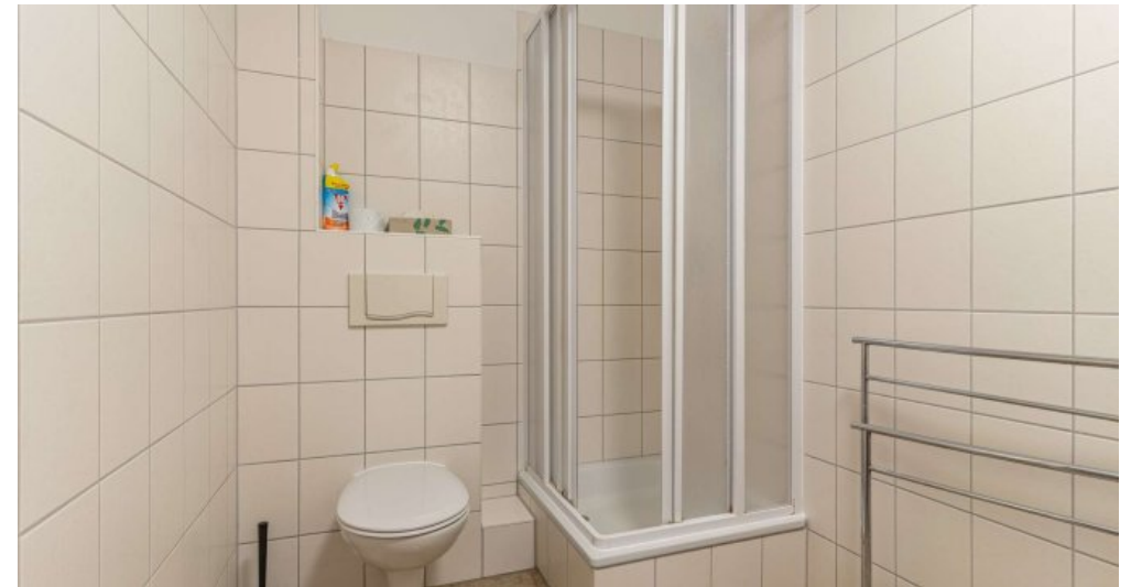
Fewo 5 - Bad