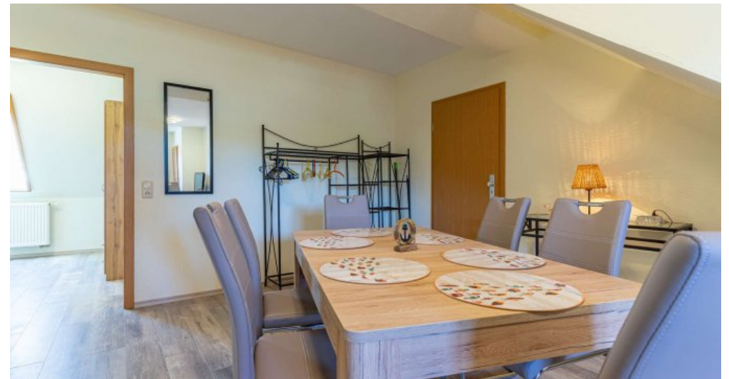
Fewo 5 - Küche