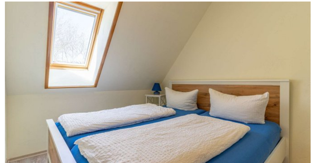
Fewo 5 - Schlafzimmer