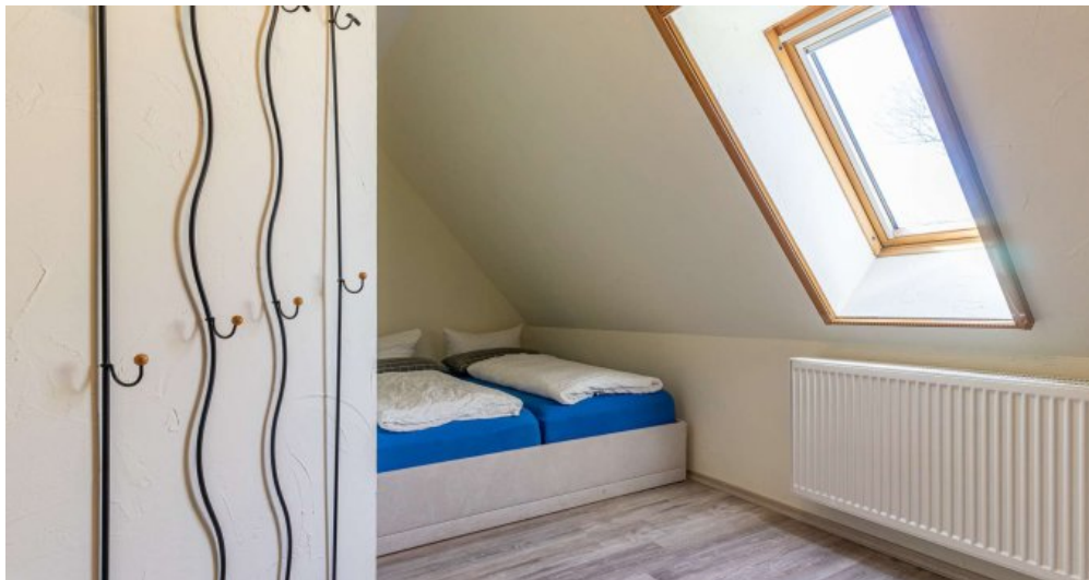
Fewo 5 - Schlafzimmer