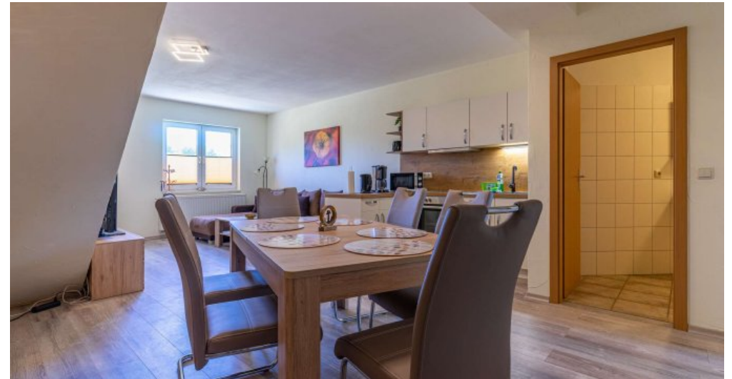
Fewo 5 - Küche