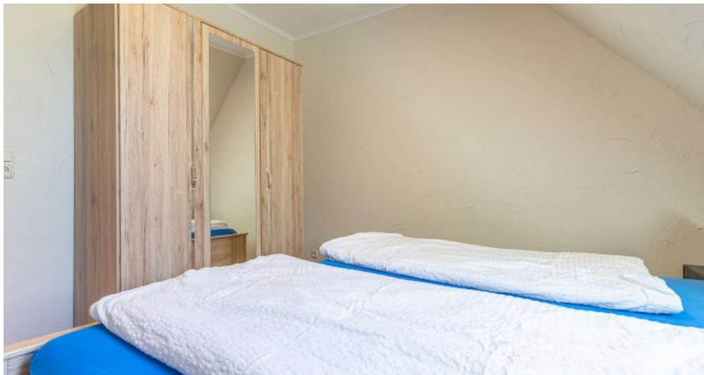
Fewo 3 - Schlafzimmer