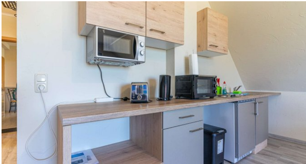
Fews 3 - Küche