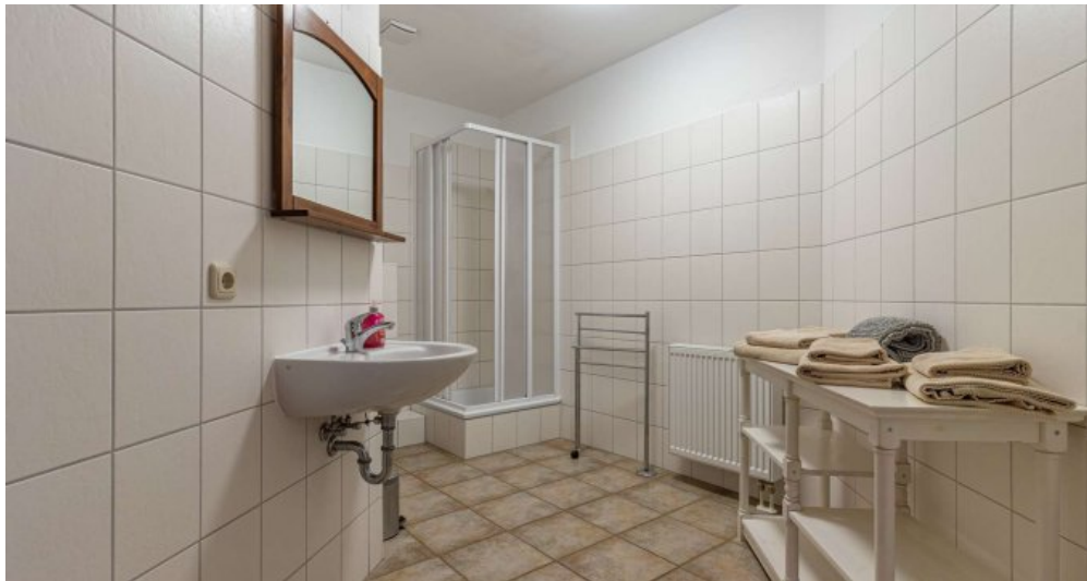
Fewo 5 - Bad