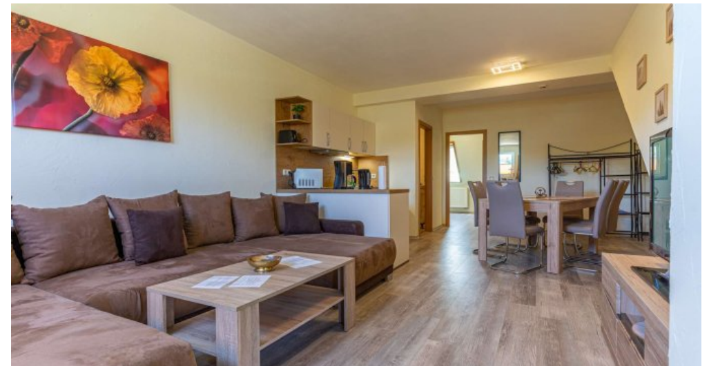
Ferienwohnung 5 -Wohnzimmer