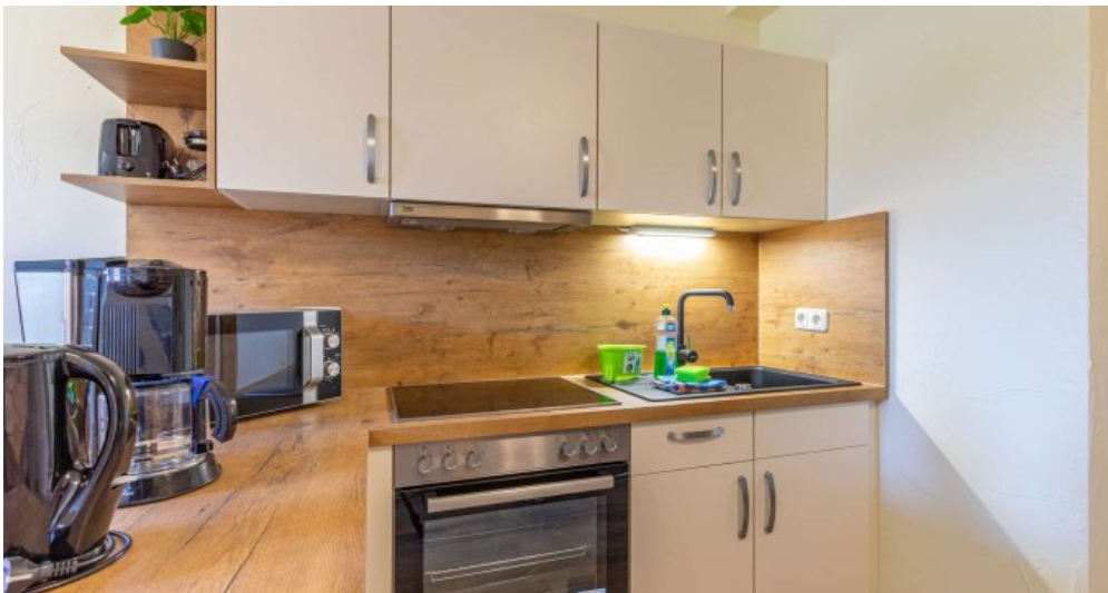
Fewo 5 - Küche