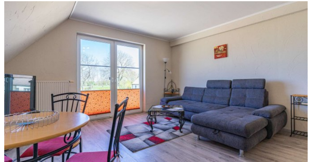
Fews 3 - Wohnzimmer