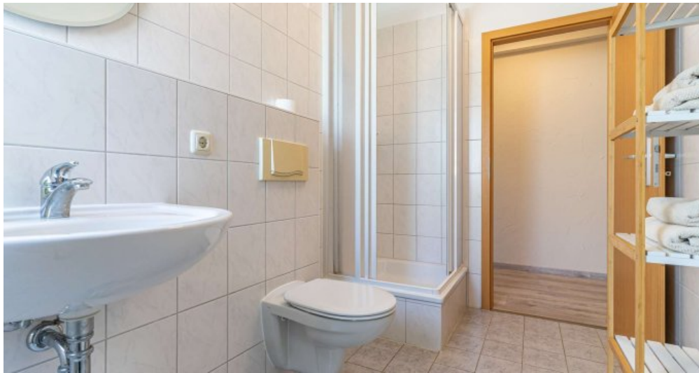
Fewo 3 - Bad